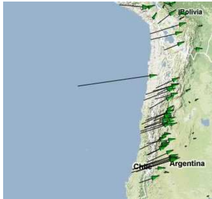
Figura 2: La velocidad de Rapa Nui (vector en el océano).

¿Qué es la inclinación? y, ¿Por qué mediciones de inclinación de rocas volcánicas antiguas en Rapa Nui no entregaría una buena estimación de su velocidad en el pasado?